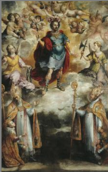
Francisco Herrera el Viejo (1590-c.1654)