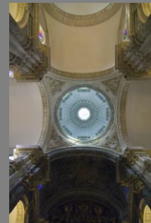
Leonardo de Figueroa (c. 1650-1730)

El arte de la pintura (y de la escultura) Los orígenes del Barroco en la plástica sevillana