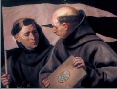
Alonso Cano (1601-1667)