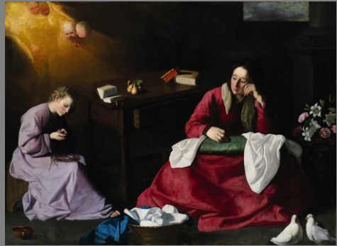
Francisco Zurbarán (1598-1664)