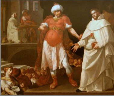
Alonso Vázquez (c. 1564 – c. 1608)