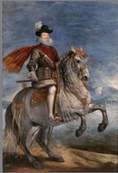
1598-1621 Reinado de Felipe III