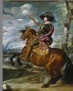
Gaspar de Guzmán y Pimentel, Conde-Duque de Olivares (1587-1645)