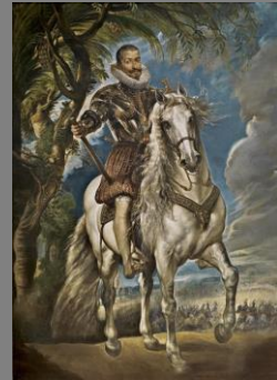
Francisco de Sandoval y Rojas, I Duque de Lerma (1553-1625)