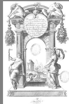
Alonso de Vandelvira (1554 c. 1626)