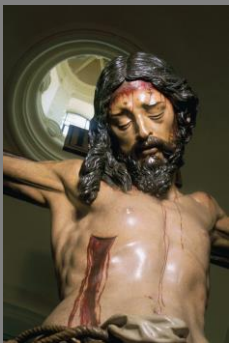
Juan de Mesa (1583-1627)