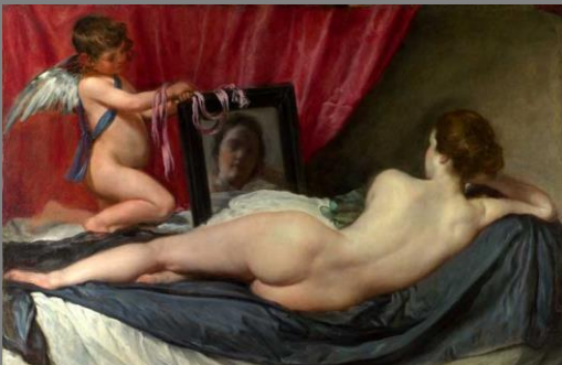
Diego Velázquez (1599-1660)