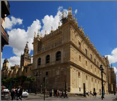
Miguel de Zumárraga: Iglesia del Sagrario (1618 ...)