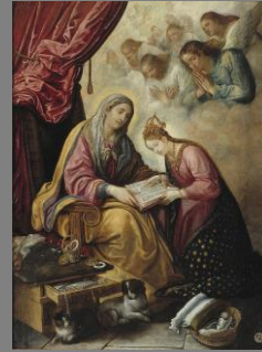
Juan de Roelas (c. 1560-1625)