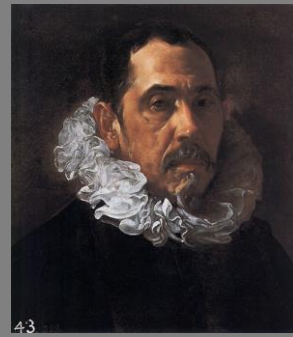
Francisco Pacheco (1564-1644)