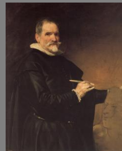
Juan Martínez Montañés (1568-1649)