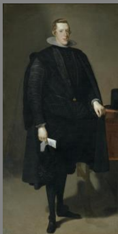
1621-1665 Reinado de Felipe IV