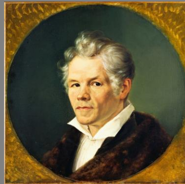
Karl F. Schinkel (1781-1841)