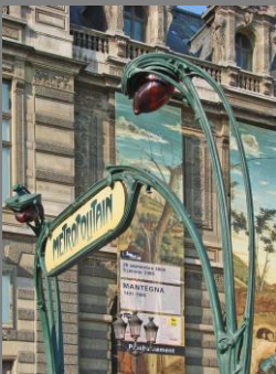
Hector Guimard: Estaciones del metro, París, 1900