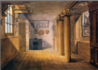
John Soane: Casa propia (Lincoln's Inn Fields), Londres, 1812 ...