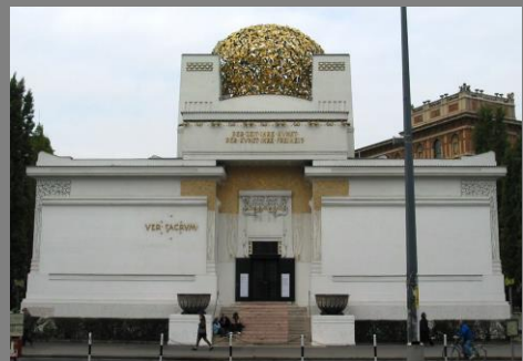
Josef M. Olbrich: Edificio de la Secesión, Viena, 1896