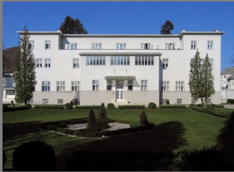
Josef Hoffmann: Sanatorio de Purkersdorf, Viena, 1906