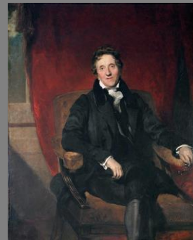
John Soane (1753-1837)