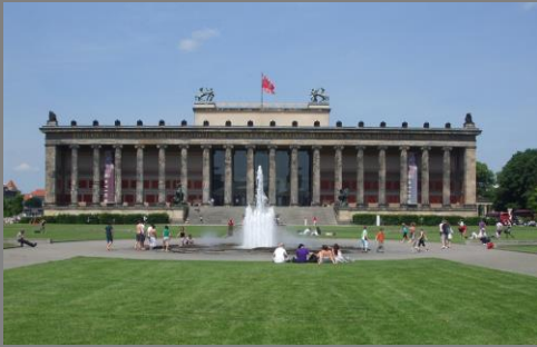
K. F. Schinkel: Altes Museum, Berlín, 1823-1830

Estética y tecnología El desarrollo de la arquitectura en la segunda mitad del siglo XIX