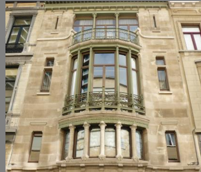
Victor Horta: Casa Tassel, Bruselas, 1.893