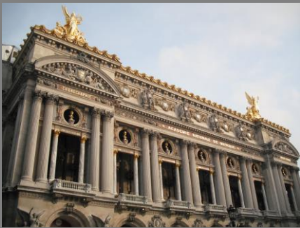
Charles Garnier. Ópera de París (1862-1875)

Estética y tecnología El desarrollo de la arquitectura en la segunda mitad del siglo XIX