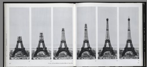
Gustave Eiffel: Torre Eiffel, París, 1889