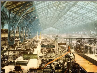
Contamin y Dutert: Galería de máquinas, París, 1889