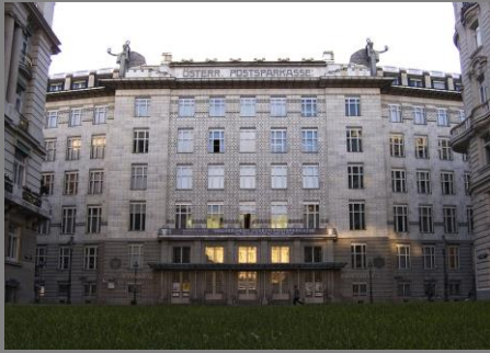
Otto Wagner: Caja Postal, Viena, 1904

¿Es el ornamento un delito? Epílogo proyectado hacia la modernidad