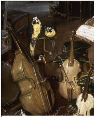
Ottó Károlyi Alianza editorial Introducción a la música