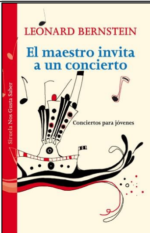
LEONARD BERNSTEIN El maestro invita a un concierto Conciertos para jóvenes Siruela Nos Gusta Saber

Alianza, Madrid, 2005 (2ª edición; 1ª edición española, 1988; edición original, 1976)